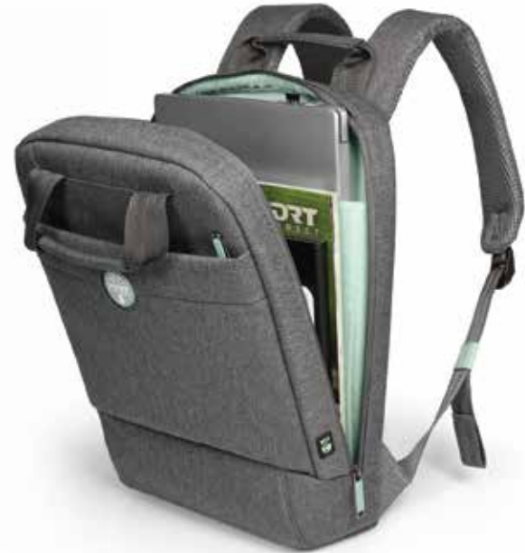
13/14" padded notebook compartment and front zipper pocket Compartment rembourré pour ordinateur portable 13/14" & poche zippée frontale