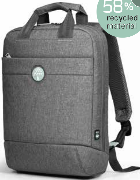
Compact & lightweight backpack Sac à dos compact & léger