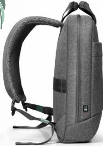
Comfortable & padded shoulder straps Bretelles confortables et rembourrées