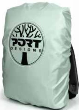
Housse de pluie incluse avec bande réfléchissante Included rain cover with light reflective band