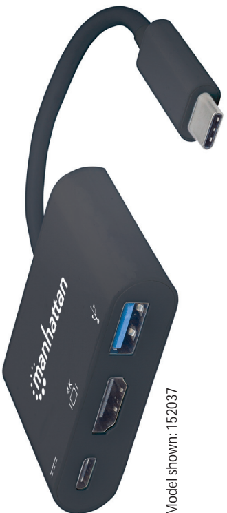
Model shown: 152037