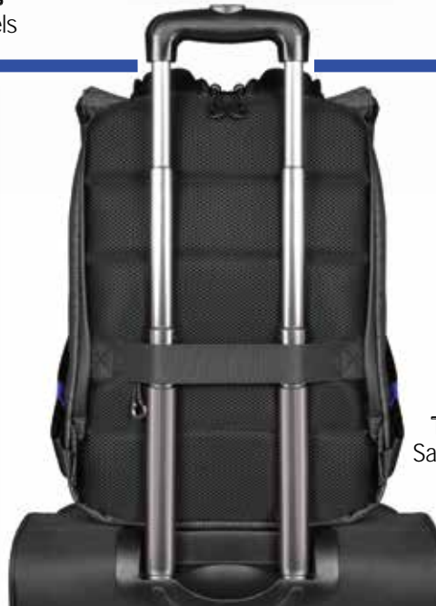
Trolley strap Sangle de trolley