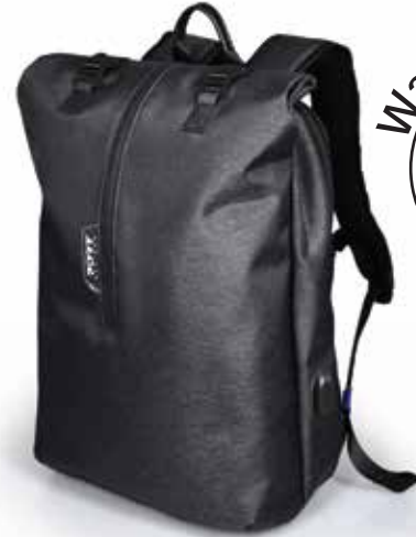
Elegant and water repellent design Design élégant et imperméable