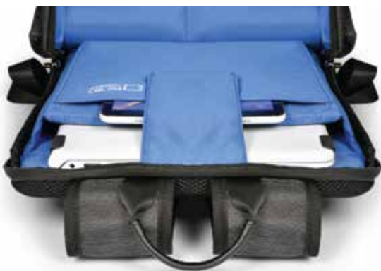
Two separate compartments for notebook and personal items Deux compartiments séparés pour notebook et effets personnels