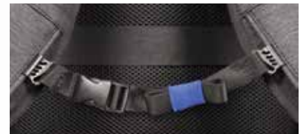
Adjustable pectoral belt Sangle pectorale ajustable