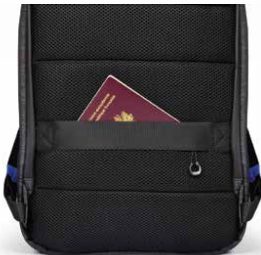
Secret back pocket for smartphone and accessories Poche arrière secrète pour smartphone et accessoires