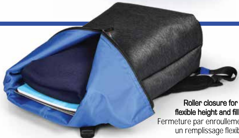
Roller closure for flexible height and filling Fermeture par enroulement pour un remplissage flexible