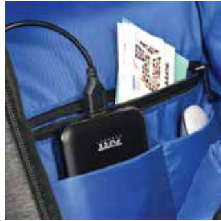
Dedicated powerbank pocket Poche dédiée batterie externe