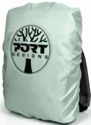
Housse de pluie incluse avec bande réfléchissante Included rain cover with light reflective band