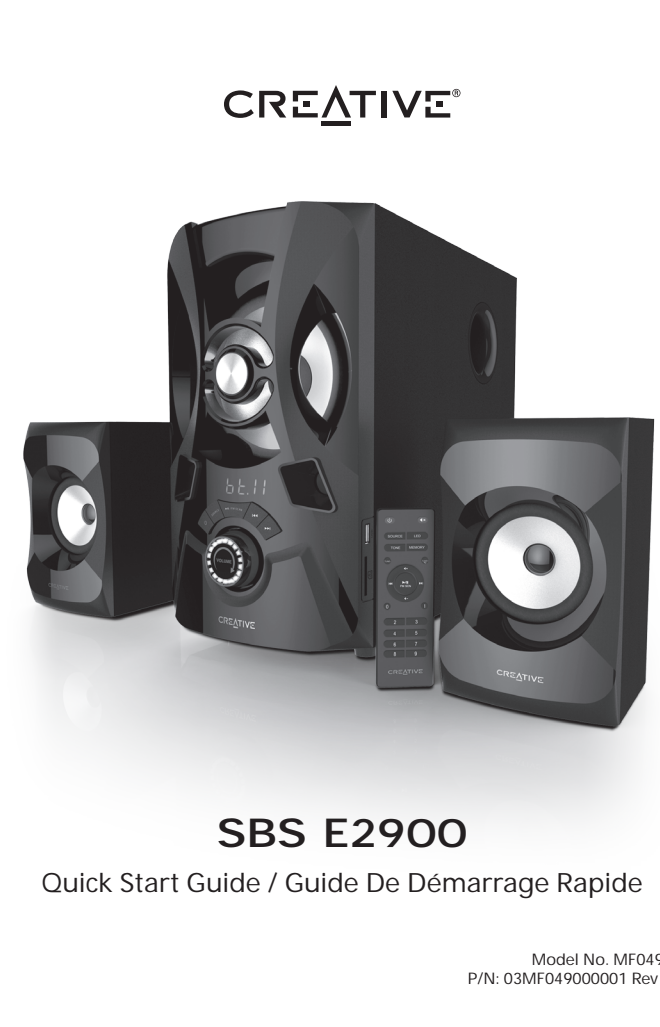
SBS E2900 Quick Start Guide / Guide De Démarrage Rapide

Model No. MF0490 P/N: 03MF049000001 Rev B