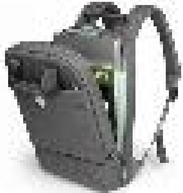
13/14" padded notebook compartment and front zipper pocket Compartment rembourré pour ordinateur portable 13/14" & poche zippée frontale