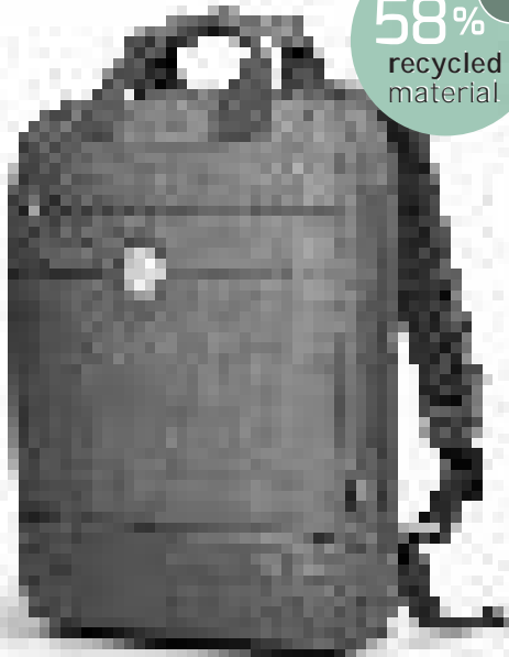
Compact & lightweight backpack Sac à dos compact & léger