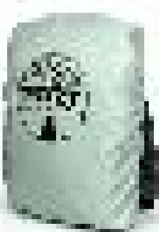
Housse de pluie incluse avec bande réfléchissante Included rain cover with light reflective band