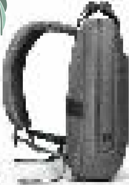
Comfortable & padded shoulder straps Bretelles confortables et rembourrées