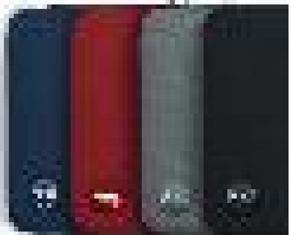
Stretchy colorful cotton neoprene Matériau extensible en néoprène coloré