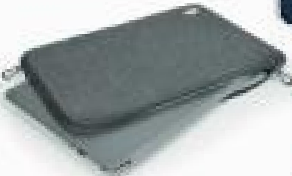
Trendy & slim design with qualitative material Design fin et tendance avec matériaux de haute qualité