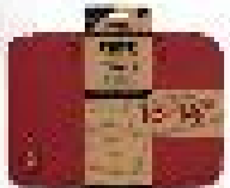
Retail packaging Packaging retail