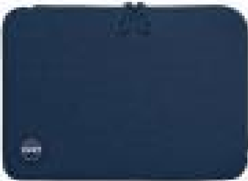
Anti scratch and protective slim fabric Tissus anti-rayures et protecteurs