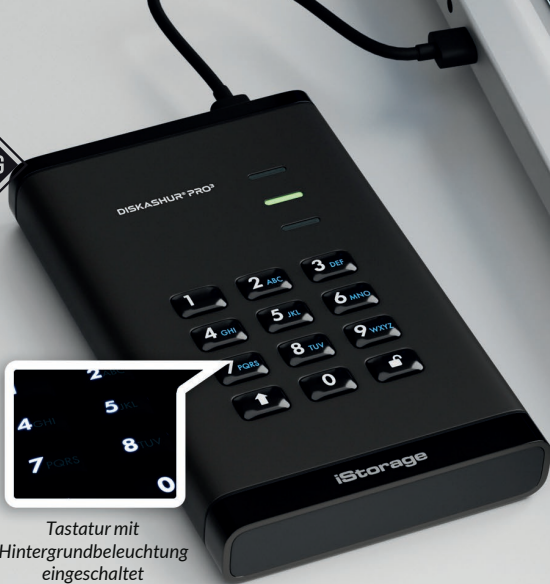
Tastatur mit Hintergrundbeleuchtung eingeschaltet

In einer Welt, in der der Schutz Ihrer wertvollen Daten höchste Priorität hat, ist der iStorage diskAshur PRO 3 die ultimative Wahl, wenn es darum geht, Datensicherheit auf höchstem Niveau zu gewährleisten.