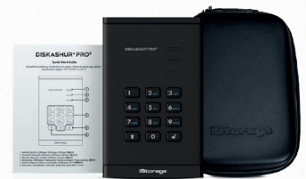
portabler diskAshur PRO 3 (HDD/SSD), Etui und Kurzanleitung