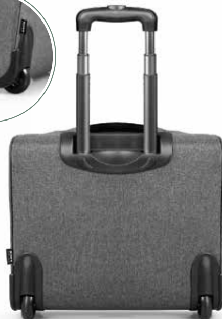
Plastic feet and rubber wheels Pieds en plastique et roues en gomme