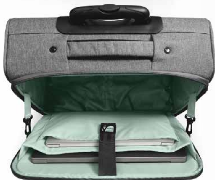
Padded notebook compartment 15.6/16" Compartment rembourré pour ordinateur portable 15,6/16"