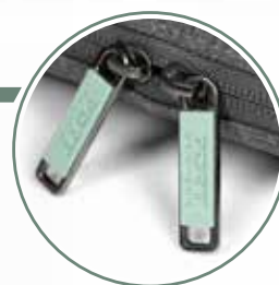
Ultra-resistant and elegant Metal puller Tirette métallique ultra résistante et élégante