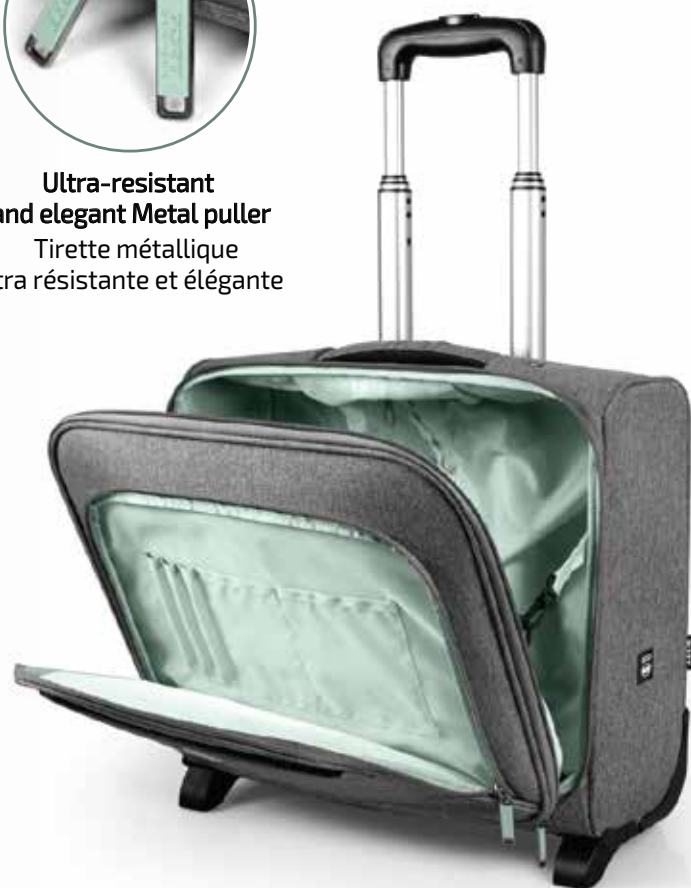
Large front pocket with organizer Grande poche avant avec organisateur

Photos submit to change/Photos non contractuelles